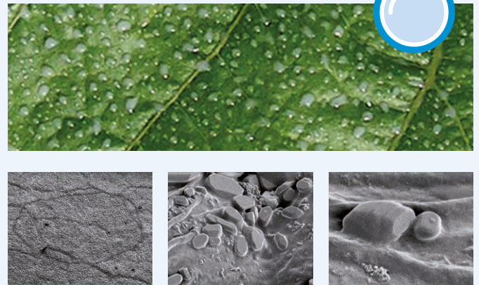
Abb. 2: Initium® bildet Wirkstoffdepots in der Wachsschicht

Die bisherigen Erfahrungen haben gezeigt, dass Orvego® eine hohe Pflanzenverträglichkeit und zur geringen Blattfleckenbildung in der empfohlenen Aufwandmenge auszeichnet. Dennoch können in Abhängigkeit von Sorte und Anbauverfahren, Schäden an der zu behandelnden Kultur nicht ausgeschlossen werden. Vor Einsatz des Pflanzenschutzmittels ist daher die Pflanzenverträglichkeit unter betriebsspezifischen Bedingungen zu prüfen.